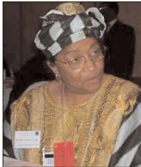
Il neo-presidente Ellen Johnson Sirleaf

Le scuole sono confessionali, legate cioè all'attività dei religiosi di ogni